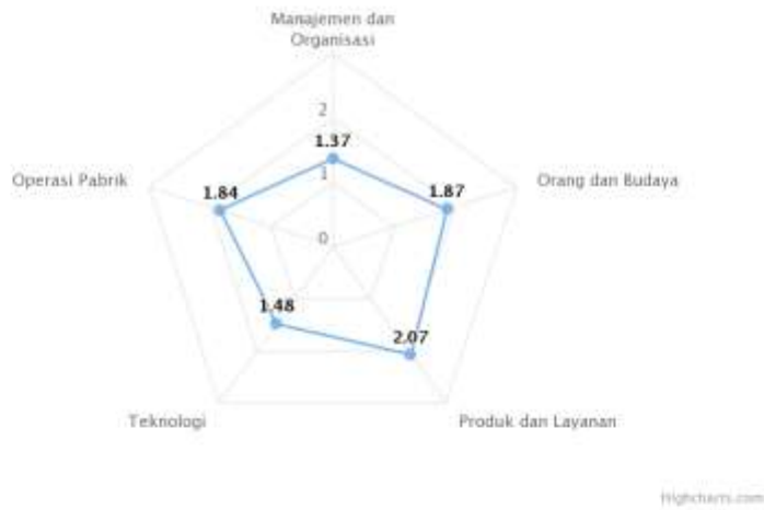
Grafik INDI 4.0 ( contoh )