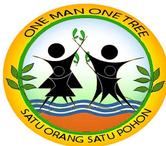
Gambar 2. Logo Kegiatan Penanaman Satu Orang Satu Pohon ( One Man One Tree )

Untuk mempermudah pengenalan terhadap program tersebut diatas, berikut adalah logo kegiatan Penanaman Satu Orang Satu Pohon ( One Man One Tree ) :