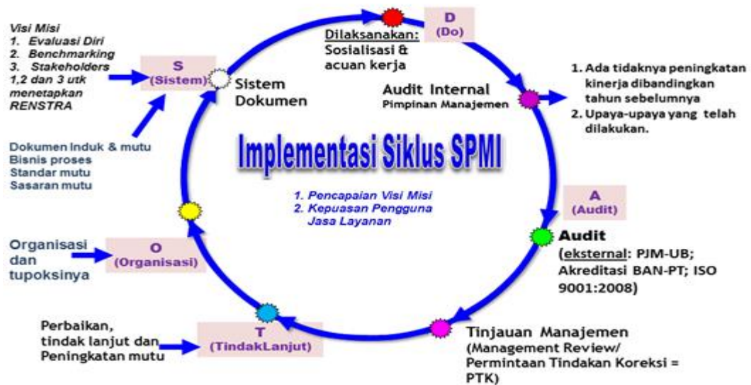
Gambar: Tahapan Implementasi SPMI di PRODI EM