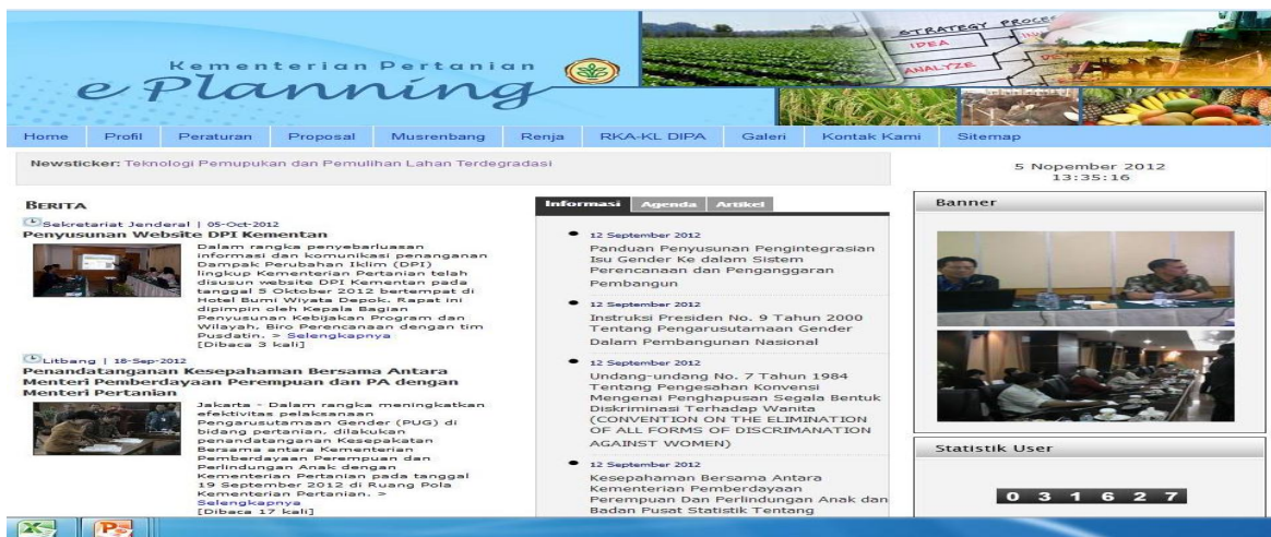
Gambar 4.1. Situs web www.pertanian.go.id/eplanning

Aplikasi e-Proposal dapat diakses pada laman www.pertanian.go.id/eplanning dan data proposal akan disimpan pada server Kementan. Untuk mengisi formulir proposal secara elektronik dibutuhkan sistem sebagai berikut: koneksi ke internet, perangkat lunak ( software ) browser (internet explorer 7+, mozilla firefox 2+, Opera 9+, dan Safari 2+) dengan mengakses ke situs web: dengan contoh disajikan pada Gambar 4.1.