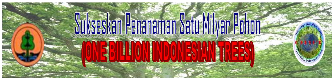
Gambar 2. Contoh Spanduk Penanaman Satu Milyar Pohon ( One Billion Indonesian Trees )