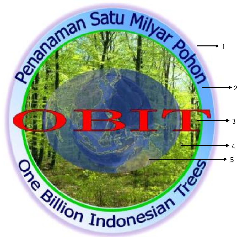
Gambar 1. Logo Kegiatan Penanaman Satu Milyar Pohon (One Billion Indonesian Trees)

Makna Logo Penanaman Satu Milyar Pohon/ One Billion Indonesian Trees (OBIT)