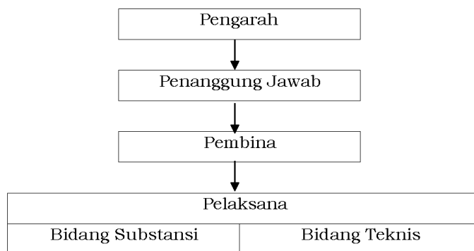
Bagan 1 Struktur Pengelola Dekonsentrasi Pusat