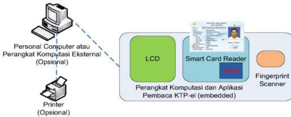
Gambar 2. Perangkat Pembaca KTP Elektronik Terintegrasi

Card Reader memanfaatkan dua faktor otentikasi untuk verifikasi otentikasi keabsahan KTP-el, keabsahan data pada cip KTP-el dan keabsahan kepemilikan KTP-el. Secara standar best practice internasional untuk otentikasi identitas, faktor otentikasi yang digunakan terhadap KTP-el adalah otentikasi terhadap keabsahan cip pada kartu KTP-el (“Apa yang Anda miliki” - “ what you have ”) dan otentikasi terhadap kepemilikan kartu KTP-el, yaitu otentikasi karakteristik khas biometrik Penduduk berupa Sidik Jari dan/atau foto wajah (“Apa karakteristik khusus Anda yang melekat” - “ what you are ”). Berdasarkan Undang-Undang Nomor 23 Tahun 2006 tentang Administrasi Kependudukan sebagaimana telah diubah menjadi Undang-Undang Nomor 24 Tahun 2013, dalam KTP-el disediakan ruang untuk memuat kode keamanan dan rekaman elektronik. Rekaman elektronik menyimpan data elektronik Penduduk yang dapat dibaca secara elektronik dengan alat pembaca dan sebagai pengaman data kependudukan.