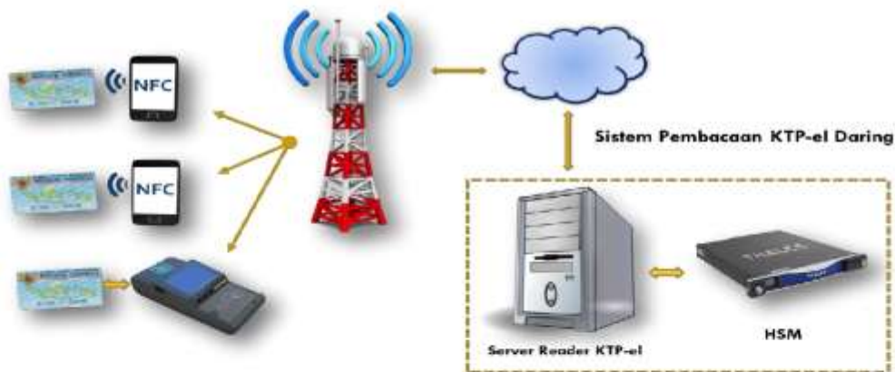
Gambar 3. Ilustrasi Secure Access Module dan/atau Kode Kunci Dalam Jaringan KTP-el (SAM Online KTP-el)

Selanjutnya, penggunaan Kartu SAM dan/atau Kode Kunci dapat dioperasionalkan ke depan melalui jaringan komunikasi data secara tertutup dan/atau terbuka sesuai yang diatur di dalam batang tubuh Peraturan Menteri ini.