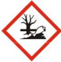
Gambar 3. Simbol B3 klasifikasi berbahaya bagi lingkungan ( dangerous for the environment )