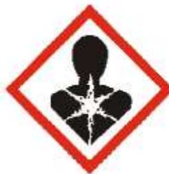
Gambar 4. Simbol B3 klasifikasi bersifat karsinogenik, teratogenik dan mutagenik ( carcinogenic, teratogenic, mutagenic )

MENTERI LINGKUNGAN HIDUP DAN KEHUTANAN REPUBLIK INDONESIA,