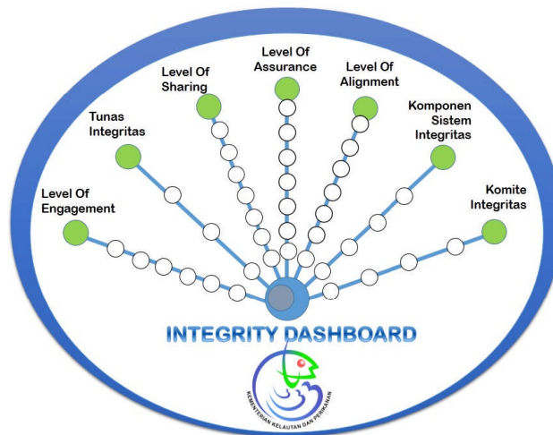
Gambar 2. Integrity Dashboard

Tujuh elemen Integrity Dashboard tersebut diuraikan sebagai berikut: