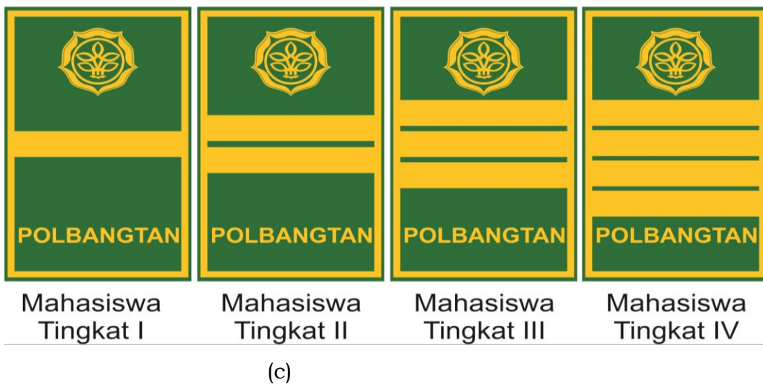
Gambar 3. topi mutz laki-laki (a), topi mutz perempuan (b), dan pangkat/dek PSH/PSU (c)