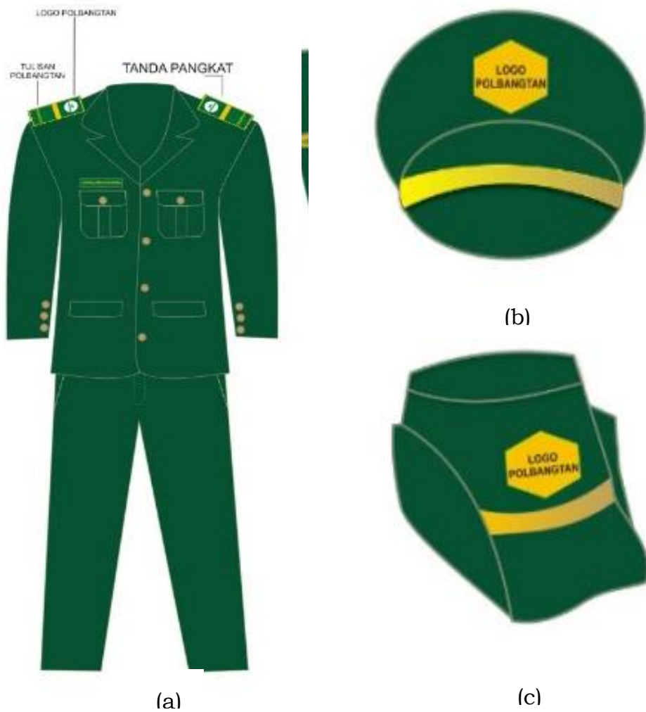
Gambar 1. PSU (a), topi pet laki-laki (b) dan topi pet perempuan (c)