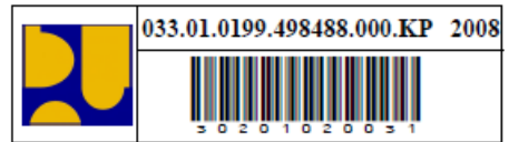
Label Barcode Ukuran Kecil