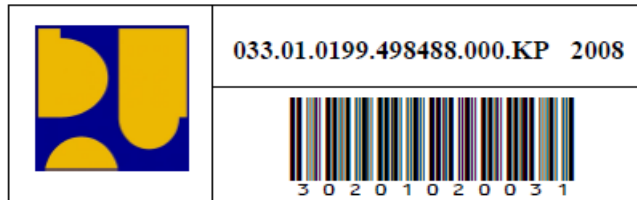
Label Barcode Ukuran Besar